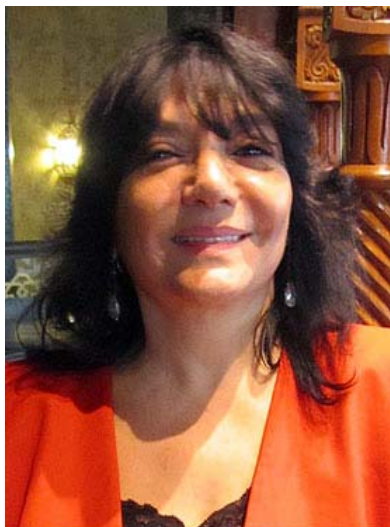
Salwa Neimi (Sevilla 2010)

La escritora siria Salwa Neimi, mundialmente conocida por su libro 'El sabor de la miel', reivindica el sexo como centro de la cultura del mundo árabe.